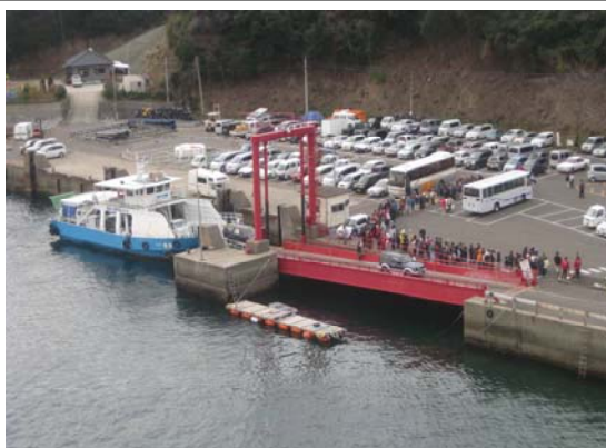
諸浦港のフェリー利用者