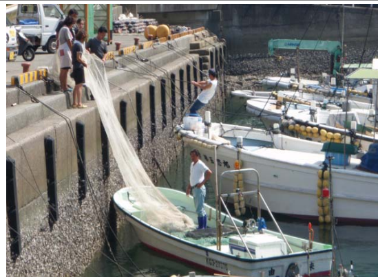
幣串漁港 漁船の陸揚げ風景