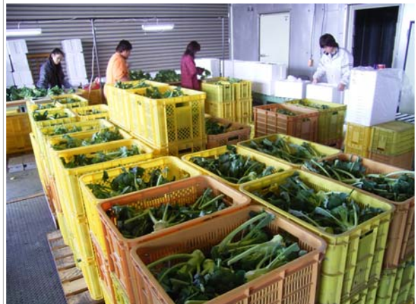
ブロッコリ出荷風景