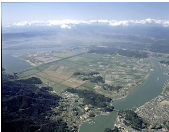
笠岡湾干拓地全景