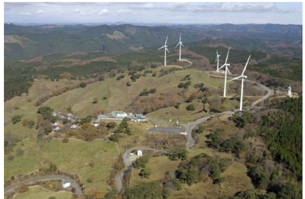
プラトー里美と風力発電施設