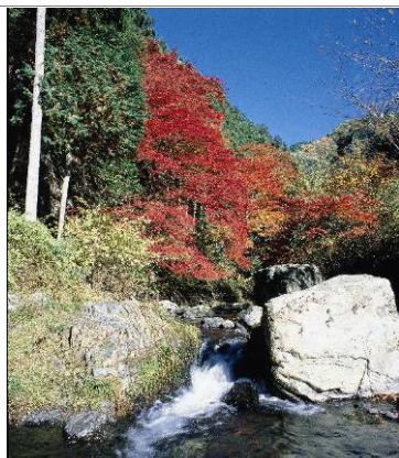
風光明媚な蓬萊山