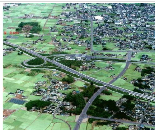
佐野田沼 IC 完成イメージ