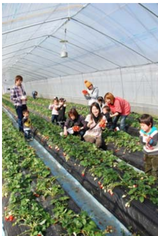
観光農園のいちご狩り