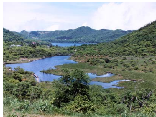
赤城山覚満淵の風景