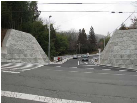
通行の安全が確保された幹線道路