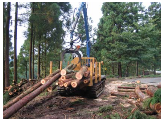
林道整備により合理化された森林作業