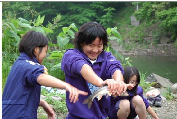
魚を捕まえる修学旅行生