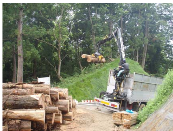
間伐材の積込・搬出