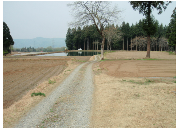
台地にたたずむ砂利敷き市道