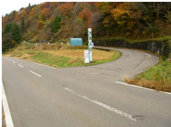
段丘を駆け上がる広域農道