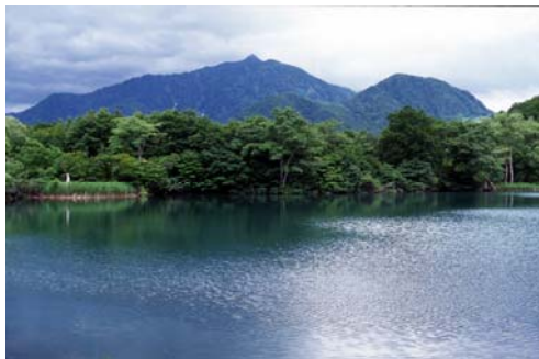
白池から見た雨飾山