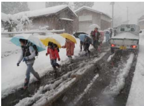
町道の危険箇所を整備解消