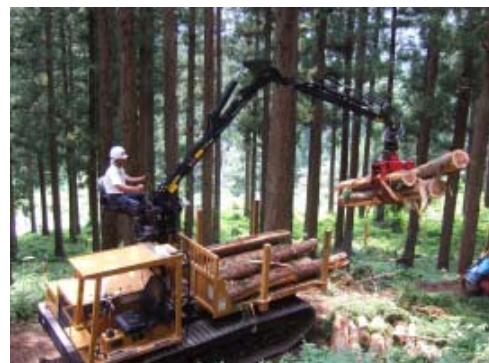
林道・町道整備により高性能機械導入団地を拡大