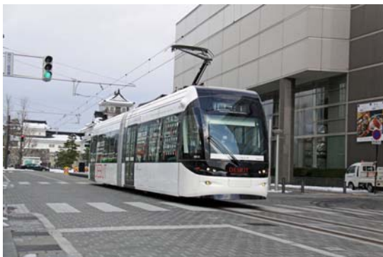
路面電車環状線化