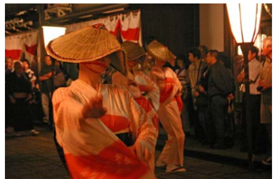
越中おわら風の盆