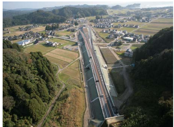
建設が進む能越自動車道