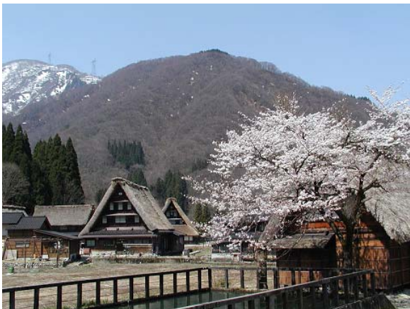
世界遺産「合掌造り集落」