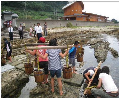
塩田村の塩つくり体験