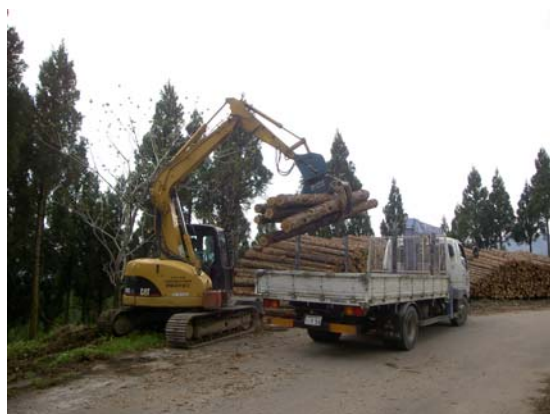
間伐木材の利用増進