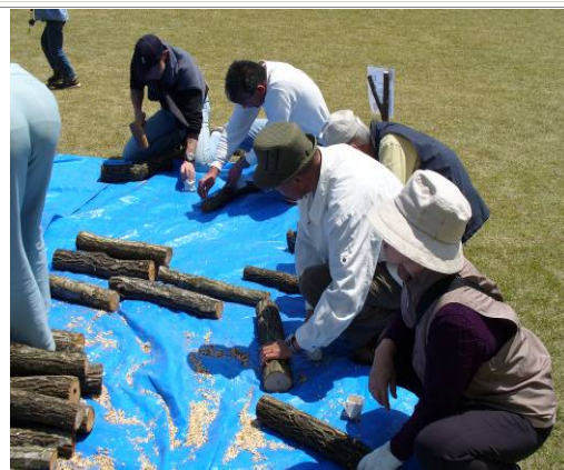
人と林産物の活性化「椎茸の原木植菌体験」