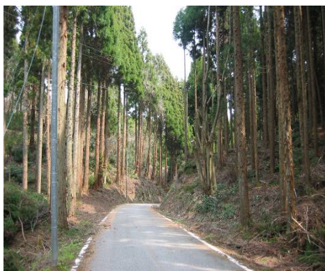
林道脇の間伐状況