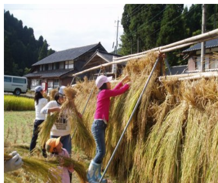
グリーンツーリズム「稲刈り体験」