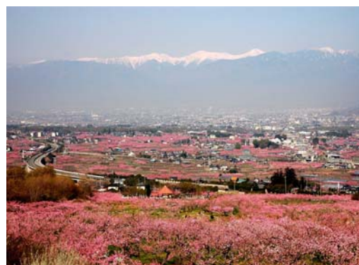
桃畑による「ピンクのじゅうたん」