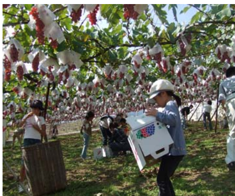
観光農園でのぶどう収穫