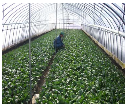
八幡平市特産の雨よけホウレンソウ