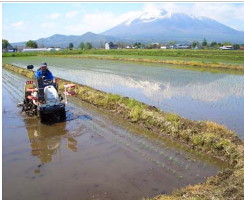
豊富な水資源を活用した稲作