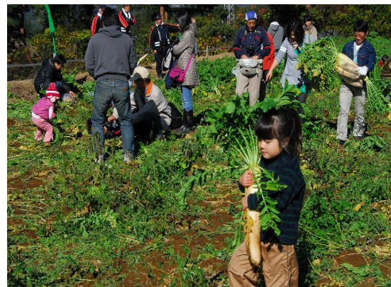
浅尾ダイコンまつり