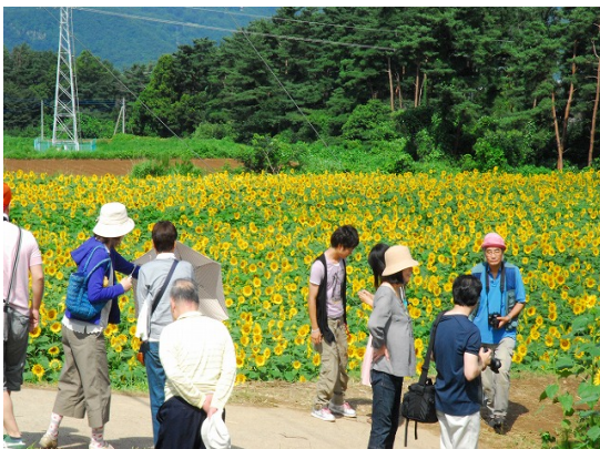
明野サンフラワーフィス会場