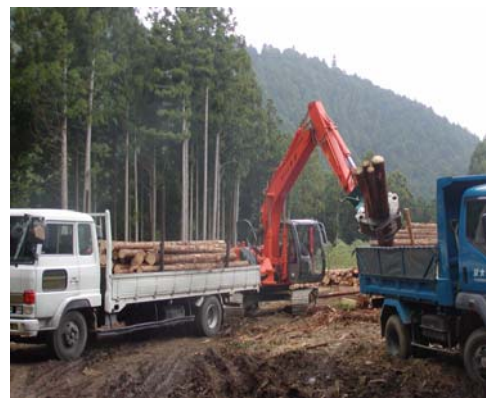
林道整備により実現した、大型林業重機による施業