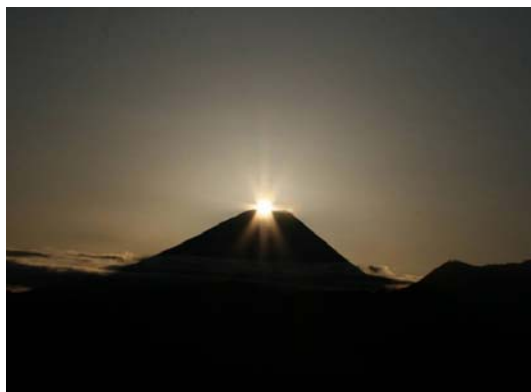
ダイヤモンド富士