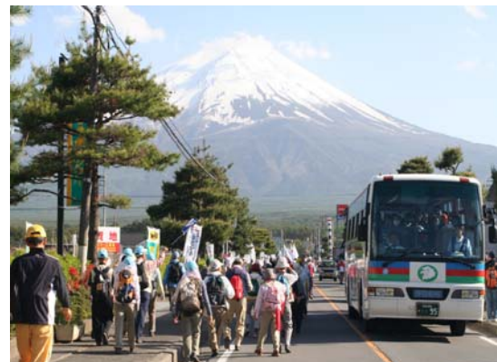
富士河口湖町を訪れる観光客