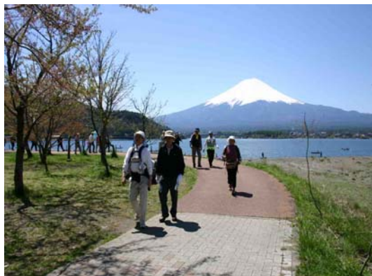
多くの観光客が訪れる河口湖周遊道路