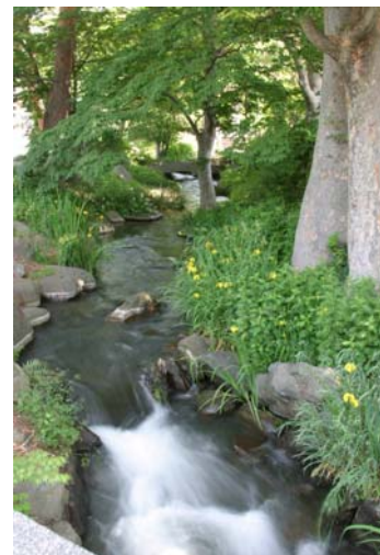
美しい山梨の清流