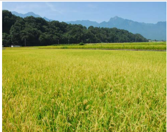
良質米を生産するための肥沃な土壌などの 自然環境