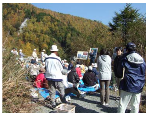
森林に親しむ市民（松川入り探訪）