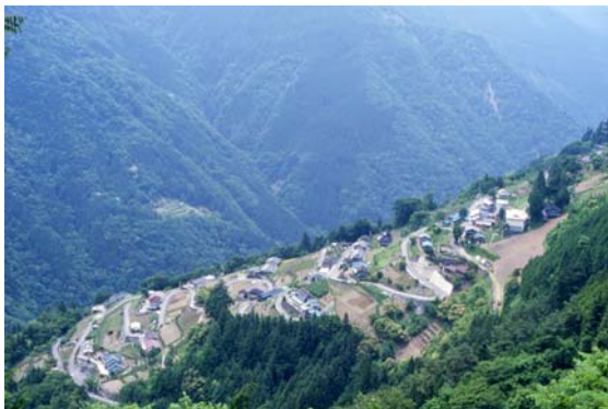
日本のチロル(下栗地区)