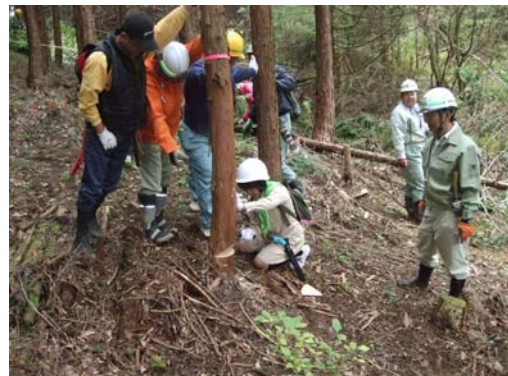
市民による除間伐体験