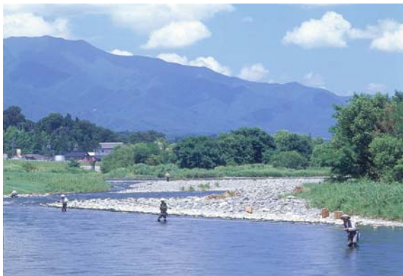
伊那市内を南下する天竜川