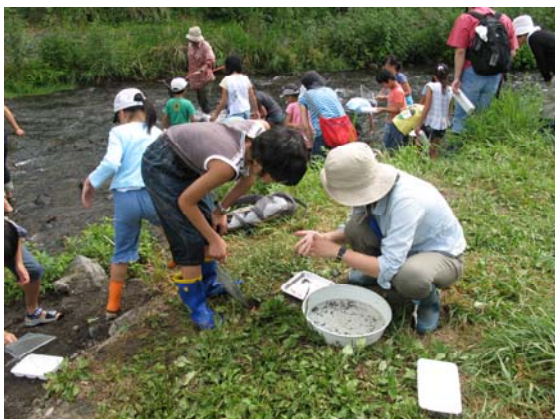
水辺で学ぶ子供たち