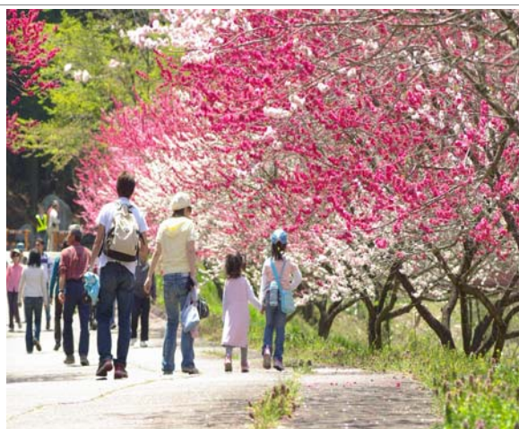
花桃の郷 花桃祭り