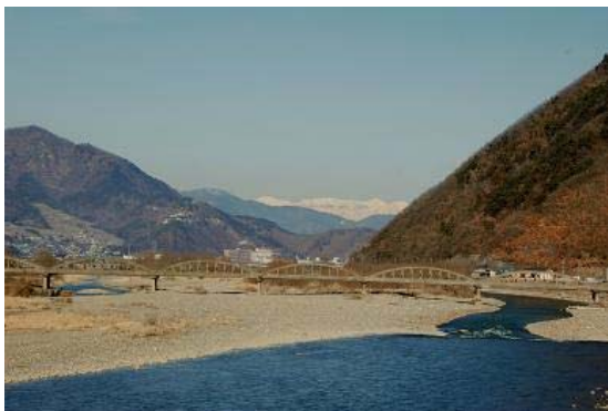
千曲川と昭和橋と北アルプス