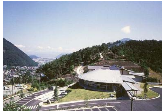
湯さん館と千曲川