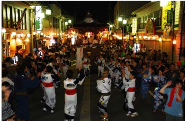
国選択無形民俗文化財「白鳥おどり」