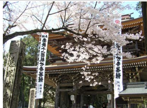
西国三十三番満願霊場 谷汲山華厳寺