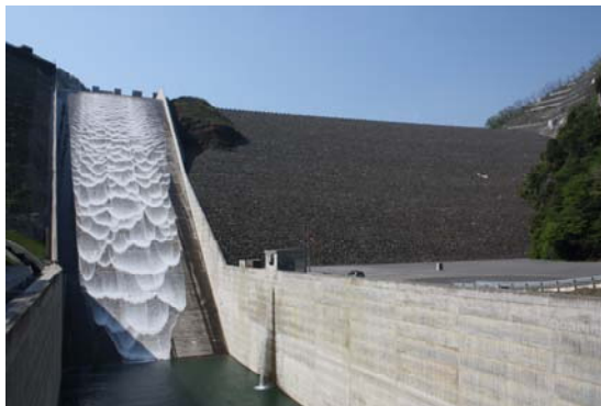
日本最大級を誇る徳山ダム