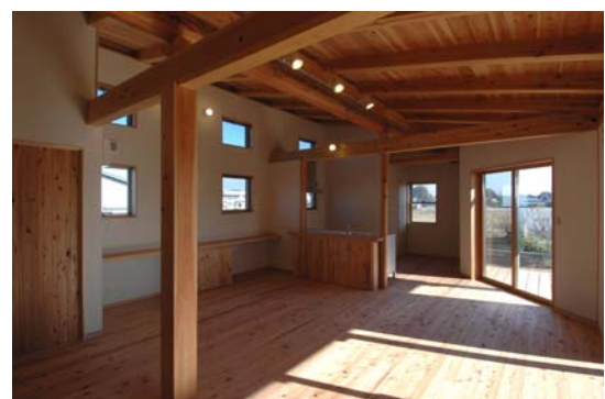
天竜美林活用住宅