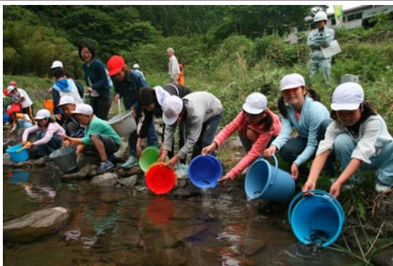
太田川への稚アユの放流