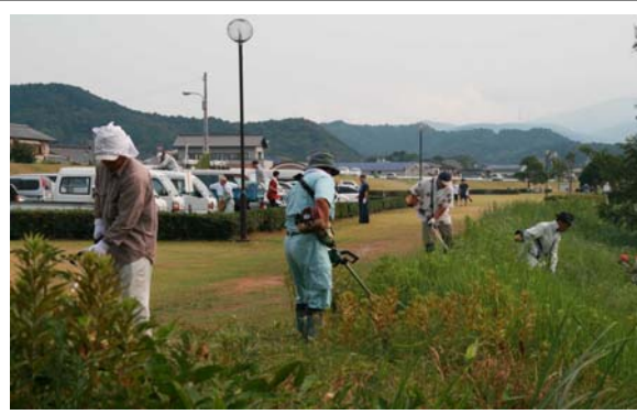
市民協働による太田川周辺的环境整備