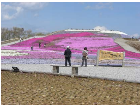
地域の観光拠点（茶臼山高原）