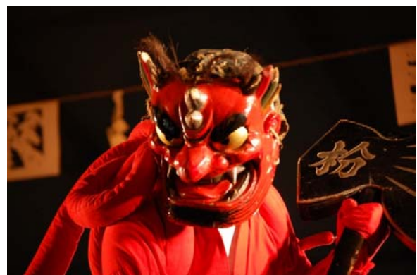
地域の伝統芸能（花祭）