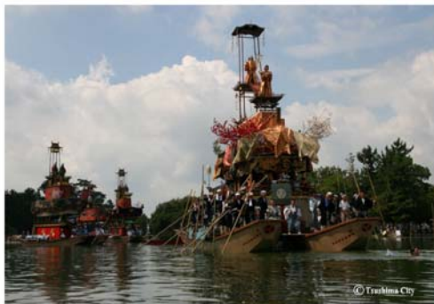
尾張津島天王祭（朝祭）