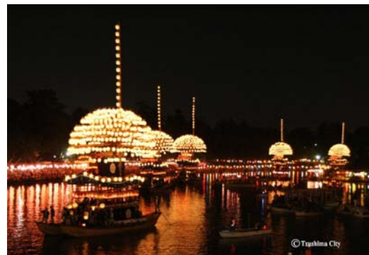
尾張津島天王祭（宵祭）