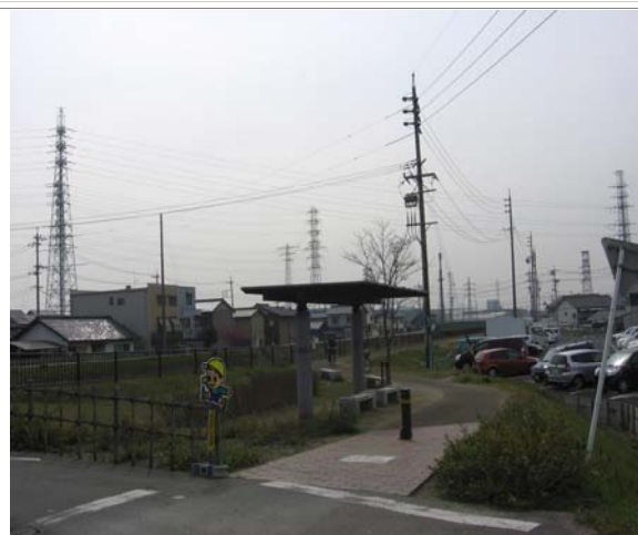
川堤防を活用した緑道 （東名高速道路下流）