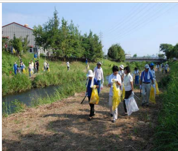
市民団体による環境美化活動（大山川）