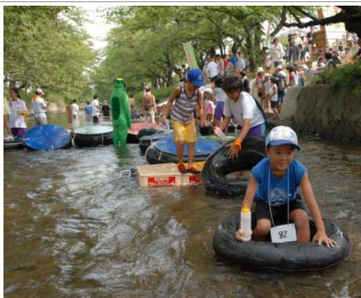
五条川の水辺まつり