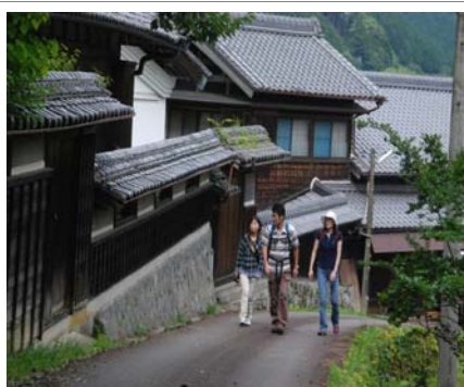
伊勢本街道及びセラピーロード