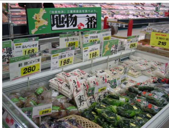
みえ地物一番の日キャンペーン協賛店