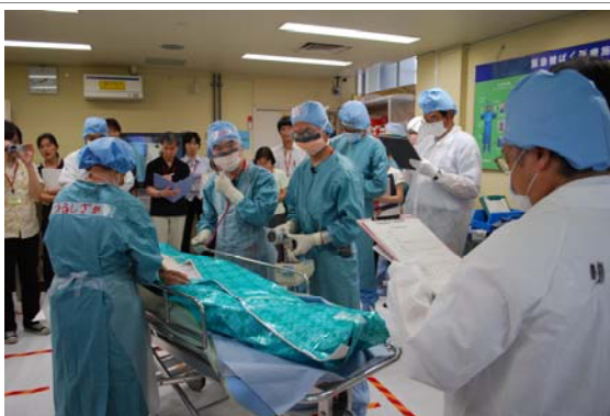
被ばく医療セミナーでのシミュレーション演習（弘前大学保健学研究科）