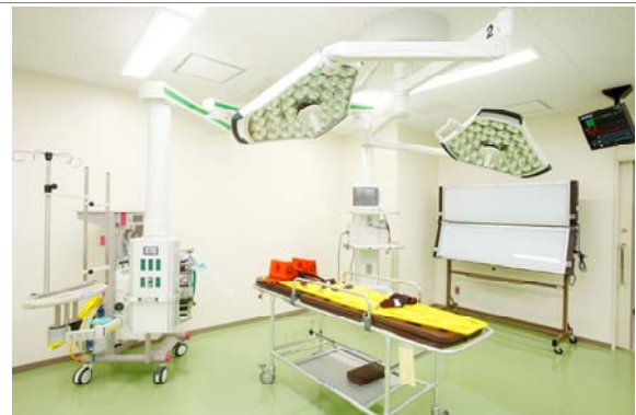
弘前大学医学部附属病院高度救命救急センターの被ばく患者特殊処置室