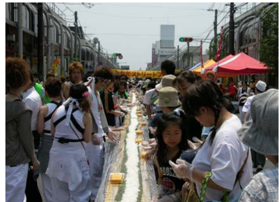
ストリートフェスタ