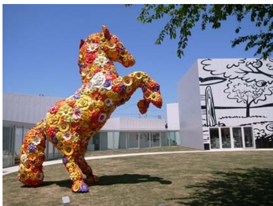
十和田市現代美術館