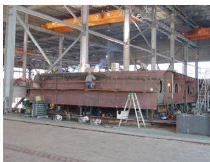
市内誘致企業での船殻ブロック溶接風景