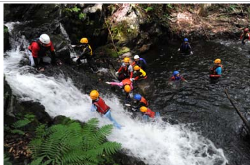
教育旅行でのシャワークライミング体験風景