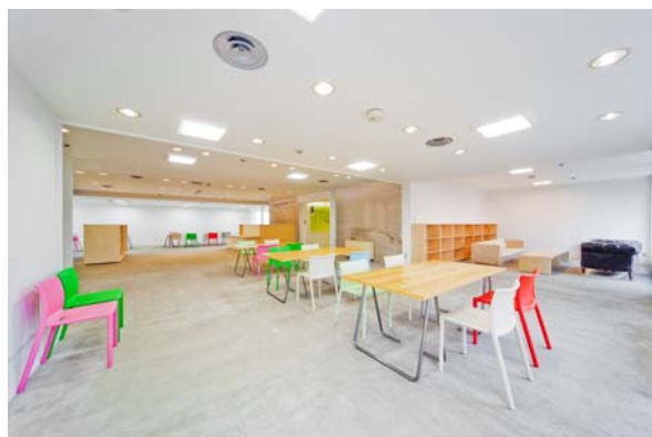
既存ストックの有効活用