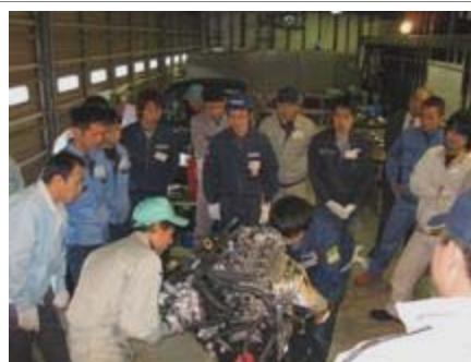
県内企業等を対象にした 自動車分解研修