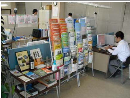
遊佐町創業支援センターの様子