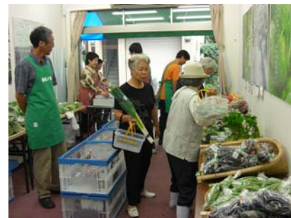
豊島区での農産物直売「遊佐ノ市」の様子