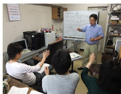
災害科学的基礎を持った 防災実務者の養成