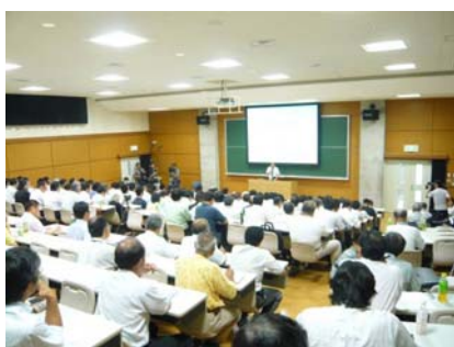
静岡県防災士養成講座