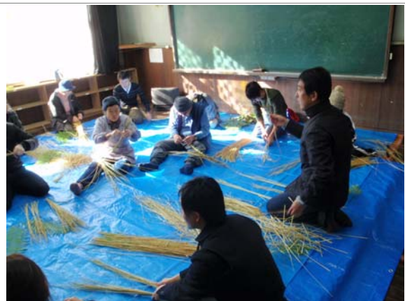
昔ながらの物づくり体験