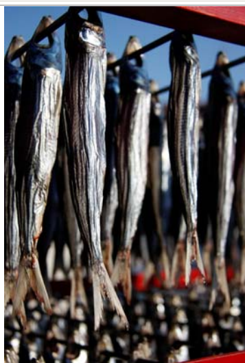
うるめの天日干し