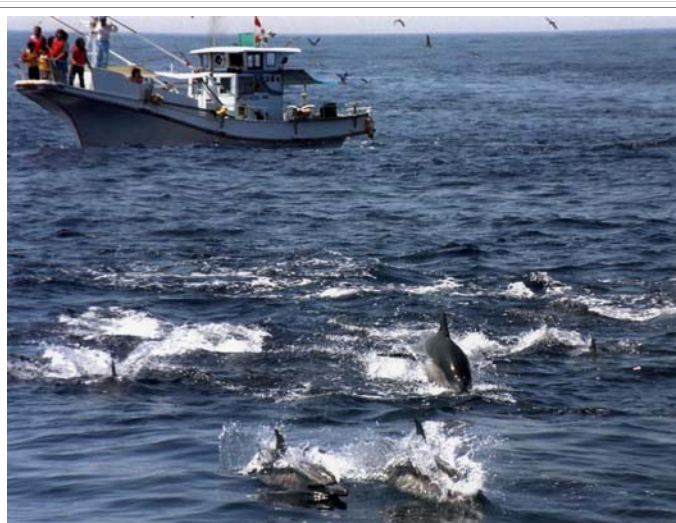
ホエールウォッチング