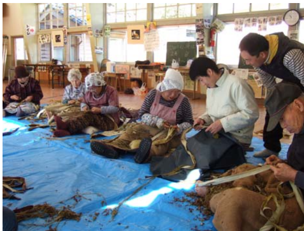
楮（土佐和紙の原料）の加工